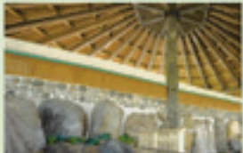
美人の湯 その昔、白鳥が傷を癒したという言い伝えが残る「美人の湯(しろとり)」はお肌だけでなく、カラダの中からきれいになれる嬉しい天然温泉。(貸切風呂付個室有)