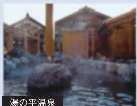
湯の平温泉 やすらぎが、こんこんと湧いている湯の平温泉。長良川源流の里に息づくよらかな宝物。忙い都会を抜け出して、山の湯でゆったりリラックスしましょう。