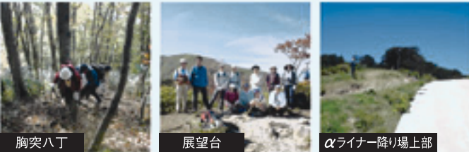
胸突八丁 ひるがの高原からのルートの途中にある急坂。疲れが出始めた辺りから見上げると頂上かと思ってしまう。晴天で続くので、無理をせず、休憩をと山も見渡せるポイント。山頂まであと少し! 展望台 ひるがの高原からのルートで、登る途中から見上げると頂上かと思ってしまう。晴天で続くので、無理をせず、休憩をと山も見渡せるポイント。山頂まであと少し! αライナー降り場上部 ダイナランドゲレンデからのルート。山頂まで一本道ですが、下山の際には他のルートと間違えない様にお気をつけ下さい。