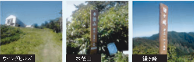
ウイングヒルズ ゴンドラ終点、建物前の右ゲレンデより登山口があります。 水後山 標高1,558.5m地点。ここから峰左右絶壁が続きます。 鎌ヶ峰 標高1,669m地点。急な登坂多々あり。