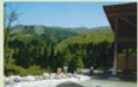
満天の湯 標高1,000m、緑の山々に囲まれ、鳥のさえずりに耳を傾けながら、露天風呂に入ること。森林浴もおこなえ、心と身体をさらにリフレッシュさせてくれるでしょう。(個室露天風呂有)