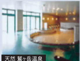
天然 鷲ヶ岳温泉 温泉の楽しみはやっぱり露天風呂。ここからは正面に大日ヶ岳などの山並みが見え、癒しに満ちています。また、天気の良い夕方には紅く染まった山々もお楽しみいただけます。