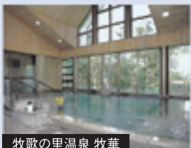
牧歌の里温泉 牧華 天井が高く窓が大きく、広々としてとても気持ちよい大浴場。窓の向こうには、高原の美しい天然林が、さらなる癒しを与えてくれます。