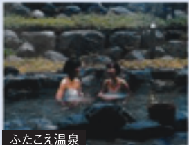
ふたこえ温泉 総合健康施設「コージュ高鷲」内にある天然温泉。山間の鷲見川の渓谷の中で静かな温泉に浸かって、のんびりしましょう。